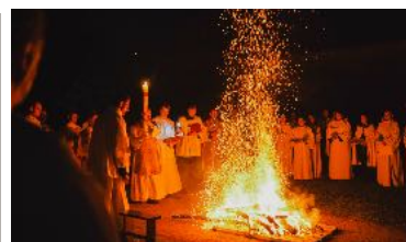
La vie liturgique est le coeur de ce qui se vit à l'abbaye. Ici, la Vigile pascale.