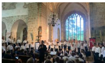
Différents chœurs sont venus faire résonner les voutes de l'abbaye. Ici, la Maîtrise de Saint Briec.

« Nous sommes particulièrement heureux de pouvoir vous associer à cette renaissance spirituelle de l'abbaye de La Lucerne en vous tenant régulièrement informé de ce qui s'y vit grâce à ce bulletin bi-annuel. »