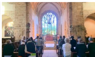
L'abbaye a reçu de nombreux pèlerins se rendant au Mont. Ici, un pèlerinage de mères de famille.