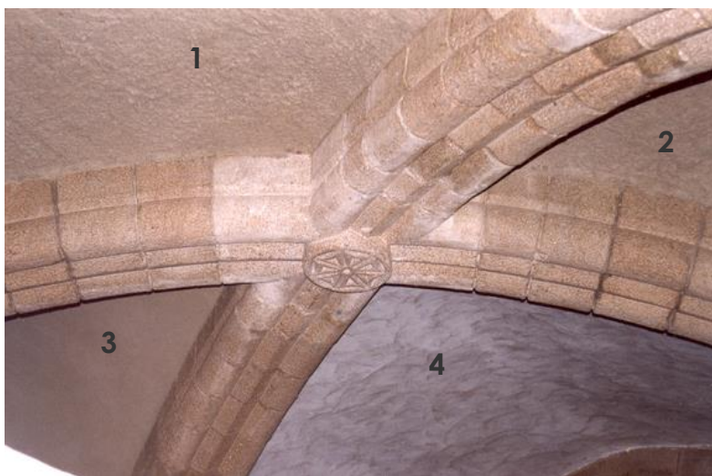
Juin 1999 : réalisation des enduits des voûtains, ici les 4 étapes sont visibles.