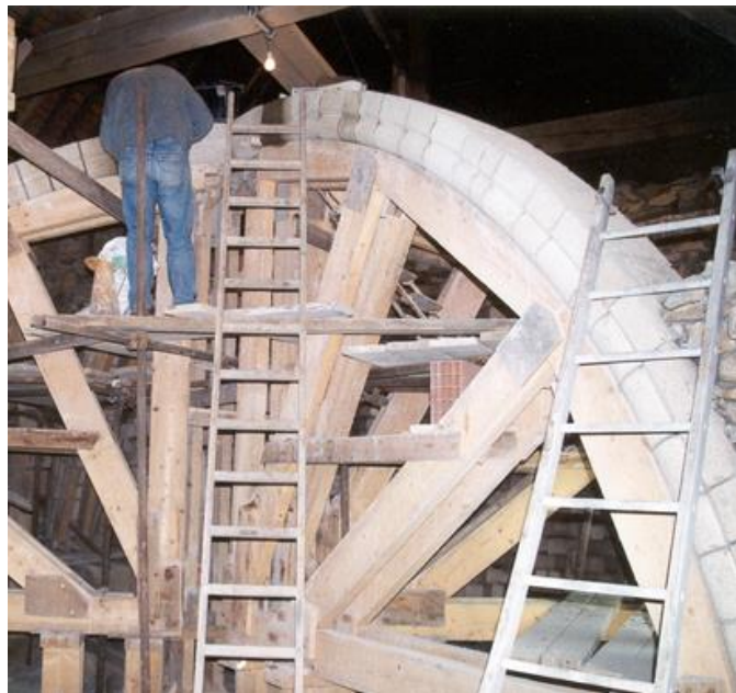
Scellement de la clé de voûte (avril 1999) et mise en place des joues Nord du gabarit de l'arc doubleau.