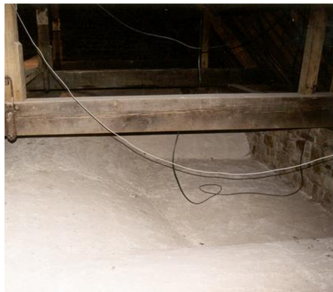
Dessus de la voûte, côté combles, avec un enduit de chaux anti-feu de 2/3 cm.