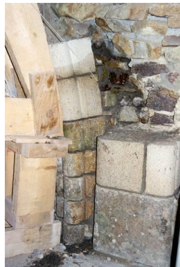
Détail : culot S/O, mars 1999.