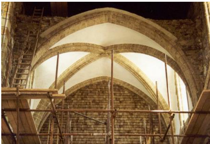
Fin de la quatrième travée de la voûte sur croisées d'ogives de la nef abbatiale.