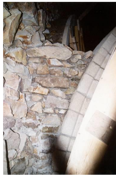
Détail : culot N/O, avril 1999